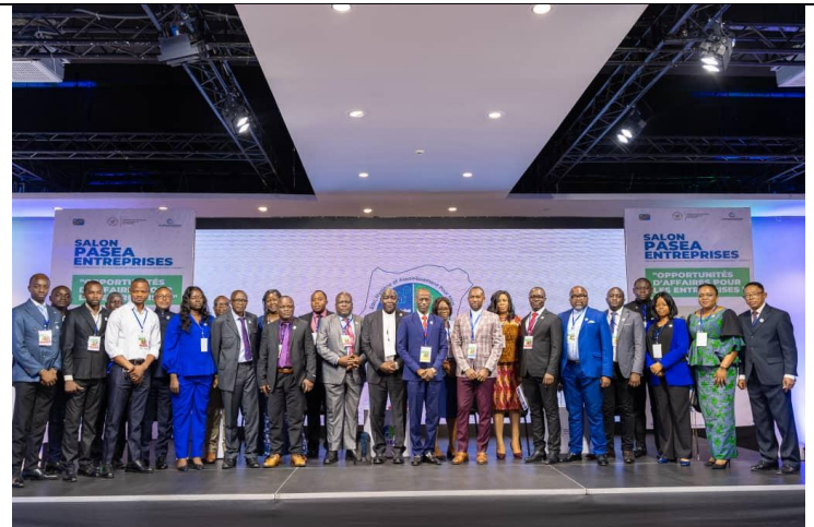
Photo de famille de la CEP-O