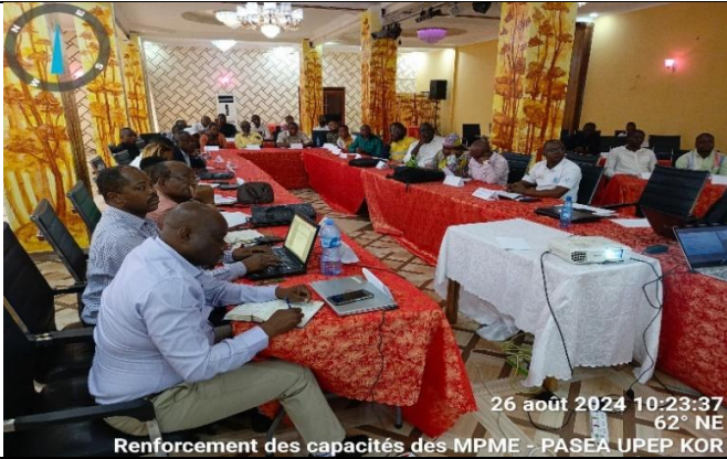
Renforcement des capacités des MPME - PASEA UPEP KOR