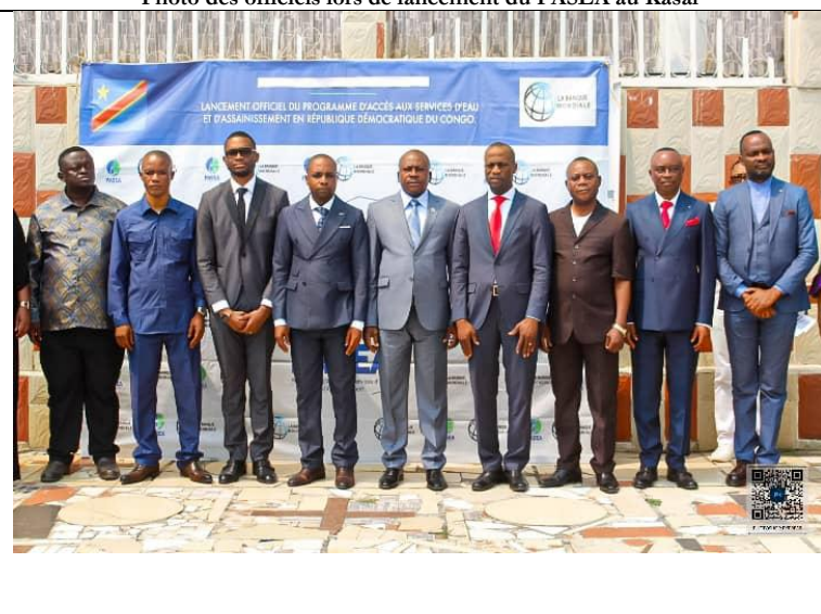
Photo de famille lors de lancement du PASEA au Kasai Central