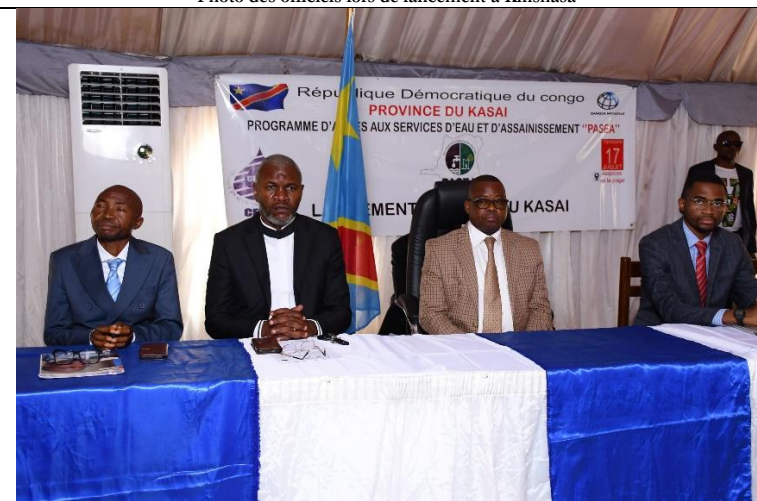
Photo des officiels lors de lancement du PASEA au Kasai