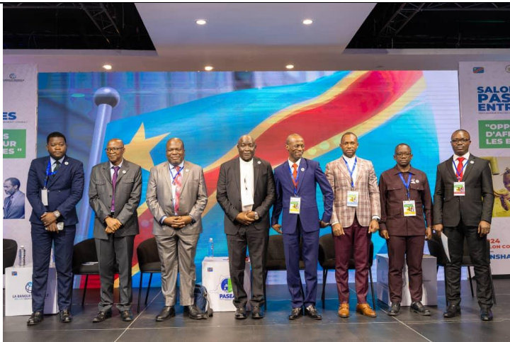
Photo de famille des panélistes