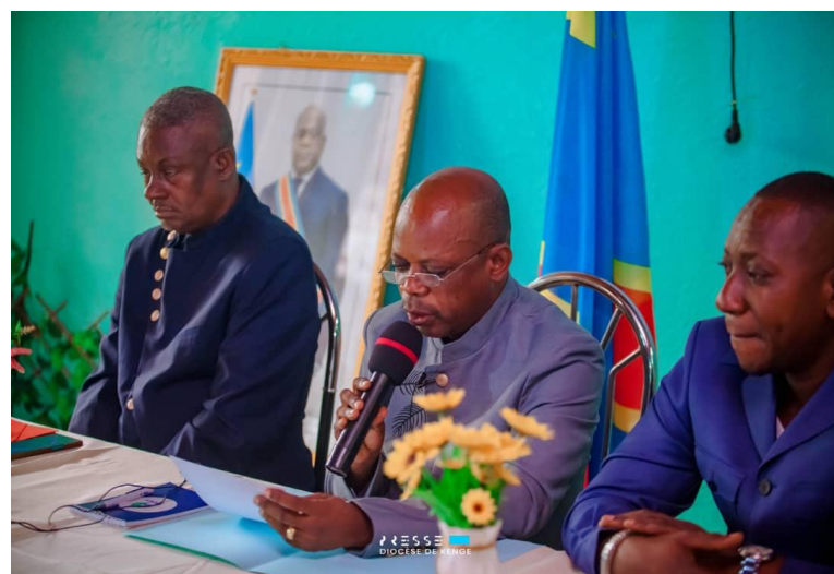
Photo des officiels lors de lancement du PASEA à Kwilu