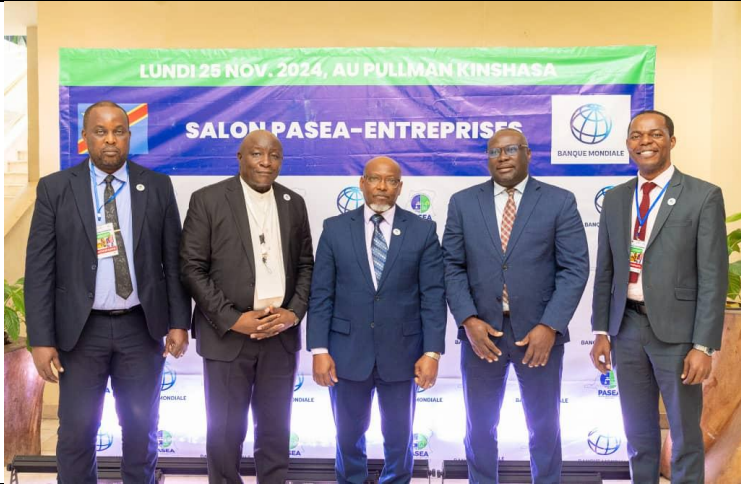
Photo de famille des officiels