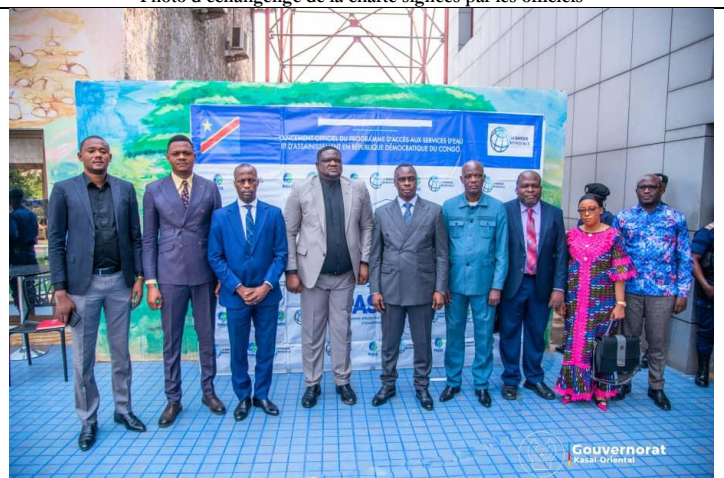
Photo de famille lors de lancement du PASEA au Kasai Oriental