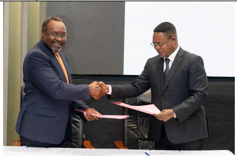
Photo d'échange de la charte signées par les officiels